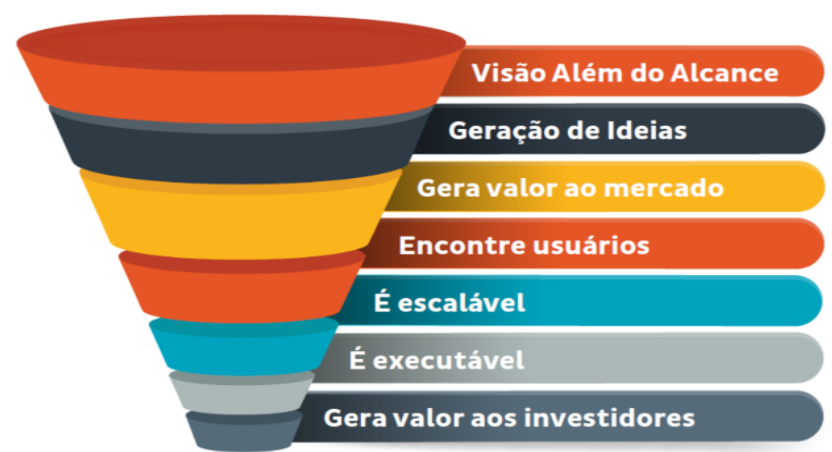
Funil para gerar Ideias Inovadoras

Sob este pensamento, a proposta do 1º pilar em gerar ideias inovadoras é, em primeira instância, levarmos a nossa mente para o futuro e permitir que a nossa imaginação crie destinos. Diante à criação e à exploração desses destinos de forma mental,