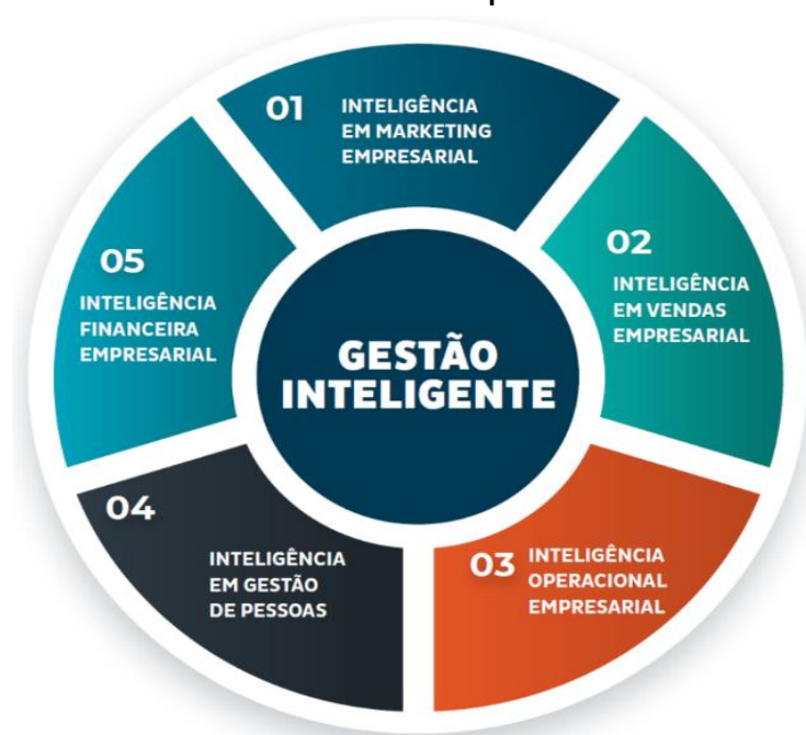
Inteligências em Gestão Empresarial

Na figura abaixo, é destacado o modelo de Gestão inteligente com seus 5 aceleradores de performance, a fim de conduzir a empresa a fluir na sua jornada para o sucesso empresarial.